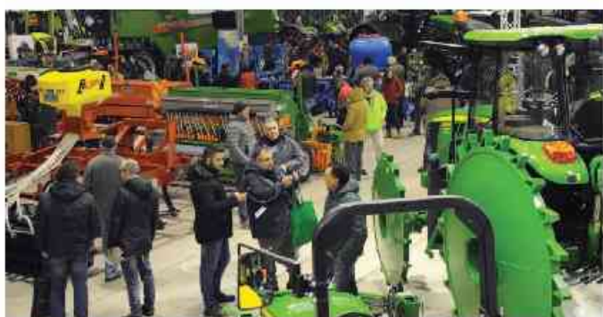
L'evento, all'edizione numero 42, durerà dal 22 al 24 febbraio

Infine c'è il taglio del nastro (venerdì alle 12) che avrà tra i testimonial proprio il ministro Centinaio, invitato anche a partecipare al tradizionale convegno di inaugura-