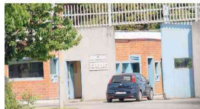
Oltre al personale in carcere ci sono trenta detenute